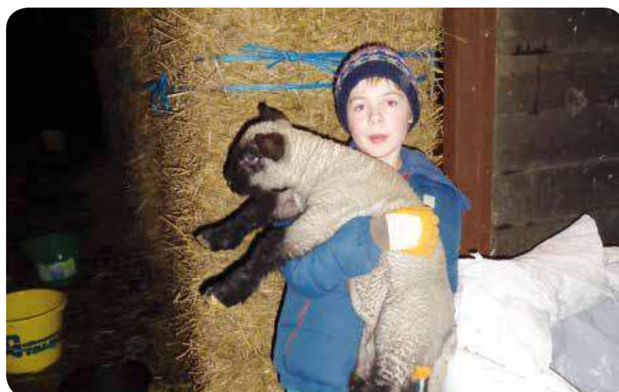
Pesée officielle réalisée par nos soins.

Cette première information est déjà très utile, mais toutefois il demeure difficile de